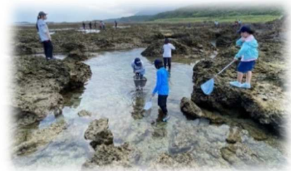
▲タイドプールで生き物探し