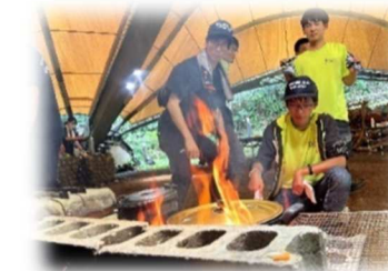
▲初めての野外炊飯