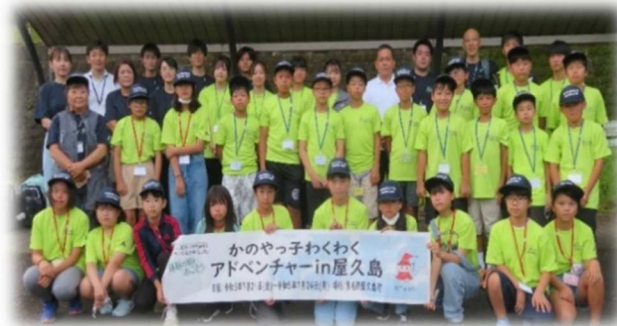
▲参加者・スタッフの集合写真