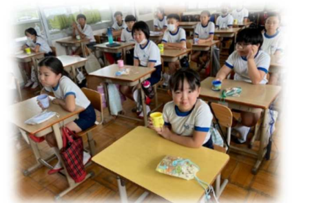
▲フッ化物洗口の様子