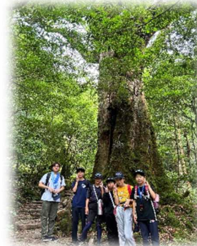
▲白谷雲水峡トレッキングでジブリの世界へ