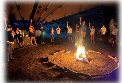
▲キャンプファイヤーを囲んで

グループで楽しく自然に触れ合ったり、心を一つにして活動することができるようになった。